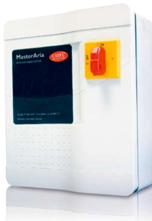
Рис. 1. MasterAria – щит управления для модульных вентиляционных установок

Контроллер MasterAria представляет собой функционально законченный щит управления, размещенный