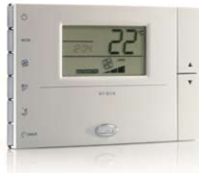
Рис. 2. Пользовательский терминал MasterAria

Кроме того, контроллер MasterAria может быть оснащен платами сопряжения для коммуникационных шин: