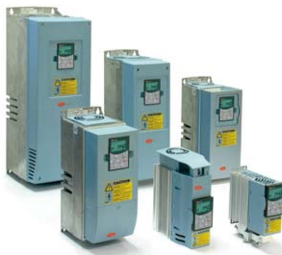
Рис. 5. Частотные преобразователи семейства NXL

Таким образом, компания Carel, расширяя номенклатуру своей продукции, стремится делать это именно в наиболее востребованных рынком направлениях, что делает продукцию Carel наиболее привлекательной для применения в современных системах управления климатическим оборудованием.