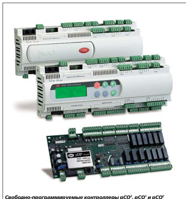
Свободно-программируемые контроллеры rCO 2 , rCO 1 и rCO C

Помимо обычных средств коммуникации система rCO поддерживает удаленный обмен информацией с помощью GSM-модема посредством SMS-сообщений.